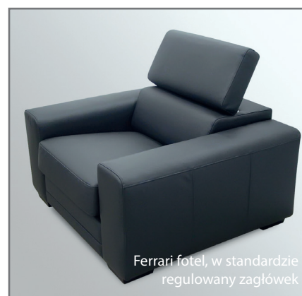
Ferrari fotel, w standardzie regulowany zagłówek