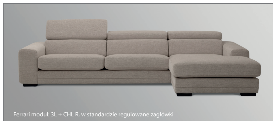
Ferrari moduł: 3L + CHL R, w standardzie regulowane zagłówki

UWAGA: przy tworzenia długich sof należy pamiętać o ZAMÓWIENIU dodatkowych nieodpłatnych nóżek FERRARI LEGS TO SOFA+SOFA