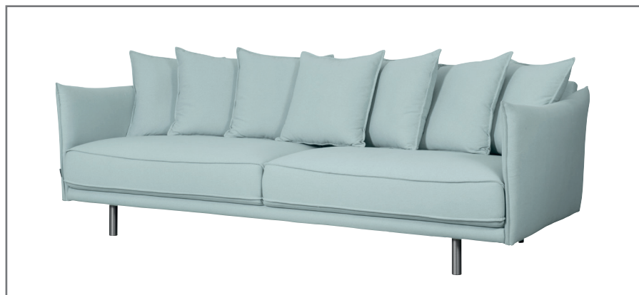
Phoenix 3 Night