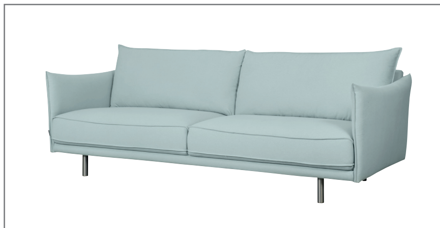
Phoenix 3 Day

Ekstrawagancki sznyt sofy nadaje specjalny szew tzw. francuski. To interesujące przeszycie jest swoistym wyróżnikiem tego mebla i sprawia, że wnętrze nie jest nudne. Poza walorami estetycznymi, sofę cechują wygoda i ergonomia, osiągnięte dzięki doskonale wyprofilowanym podłokietnikom, siedzisku i dużym, dopasowanym poduchom. To wszystko udało się zgrać w kompaktowej, lekkiej formie, dlatego też Phoenix to propozycja idealna do mieszkań, nawet tych o niewielkim metrażu. Wersja Night dostępna jest tylko w tkaninie. Wyprofilowane podłokietniki, siedzisko i małe poduszki oferują komfortowy wypoczynek.